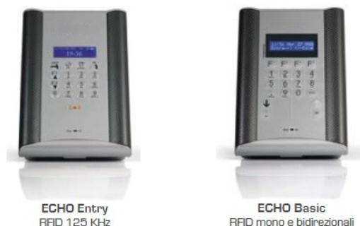
ECHO Entry RFID 125 KHz