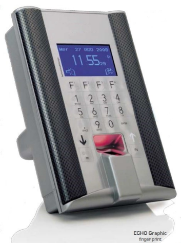
ECHO Graphic finger print

Tre sono le versioni di ECHO, pensate per dare la giusta soluzione ad ogni problematica.